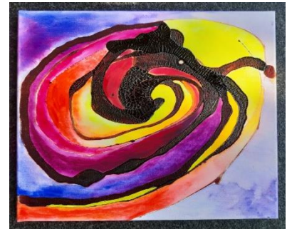
Menstruations Bilder-Reihe „Zum farbigen Fluss“