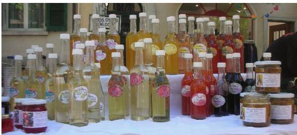
Jolanda Zurbrugg www.urspruenglech.ch